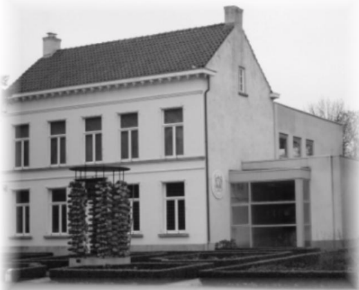
Verantwoordelijke uitgever BERT SCHENKELS voor de dorpsraad

Na de zomervakantie zal er een werkgroep opgericht worden om alle informatie te kanaliseren om zo een eisenpakket samen te stellen.