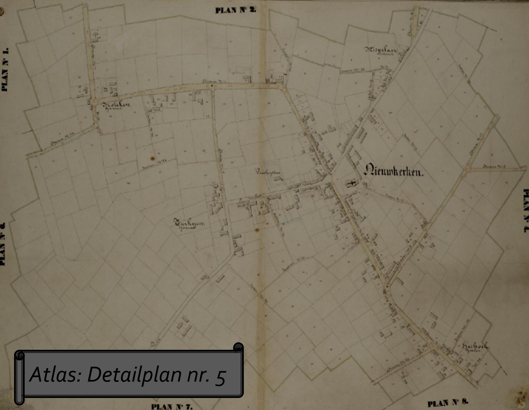
Atlas: Detailplan nr. 5