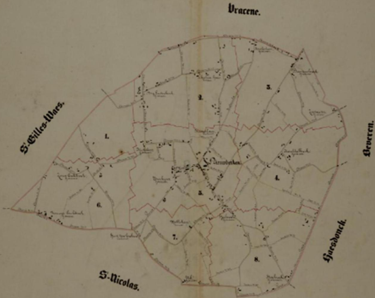
Atlas :Algemeen plan Nieuwkerken